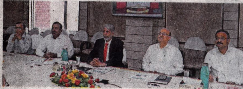
मंचासीन सेल अध्यक्ष व अन्य।